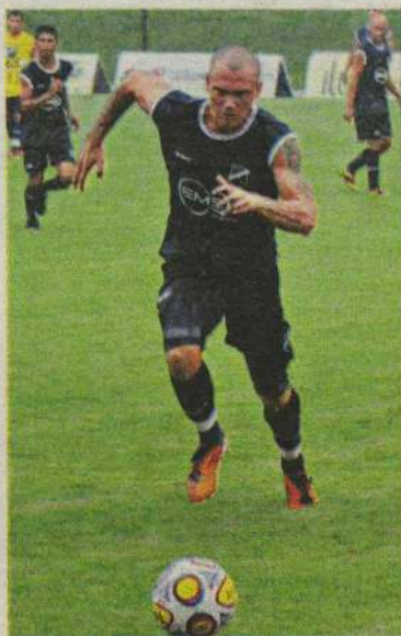
Atacante alvinegro segue suspenso