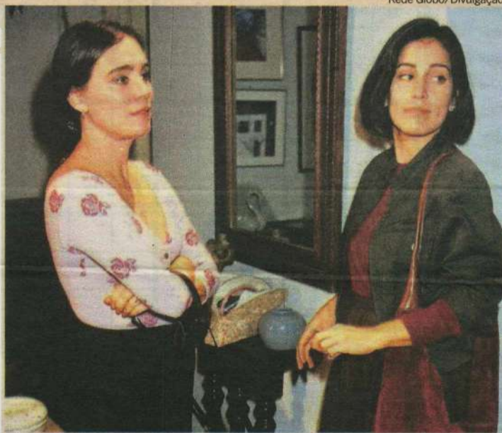
Vale tudo empolga fãs com cenas históricas de Regina Duarte e Glória Pires

Autor de Vale tudo e Anos dourados , ambas atrações na programação atual do Viva, Gilberto Bra-