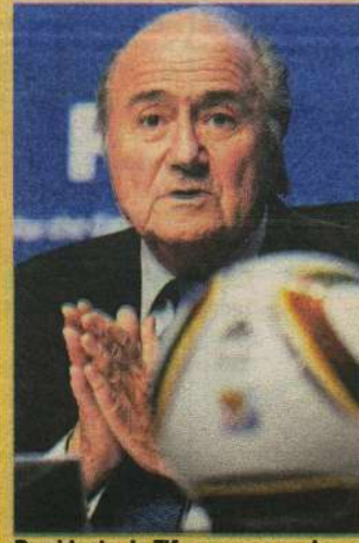
Presidente da Fifa recusou-se depor

O presidente da Fifa Joseph Blatter recusou um convite para depor em uma comissão de inquérito no Parlamento inglês. O órgão investiga os motivos do fracasso da candidatura inglesa a sediar a Copa de 2018, que, apesar de ter investido cerca de R$ 50 milhões na campanha, foi eliminada na primeira rodada de votações na Fifa, com apenas um voto, além do seu próprio. Há cerca de duas semanas, o ex-presidente da Federação Inglesa de Futebol (FA), Lordes Triesman, afirmou, em depoimento ao Parlamento britânico, que quatro membros da Fifa teriam pedido presentes ou dinheiro em troca de seus votos na Inglaterra para sediar a Copa de 2018.