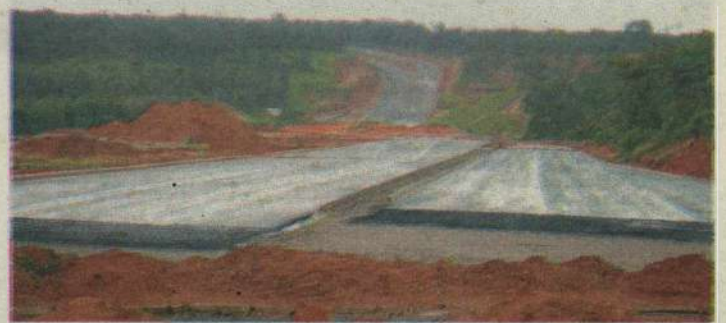
Via está concluída e asfaltada, mas não será liberada agora pelo DER

Com relação à segunda fase do projeto, a construção do anel viário com alças de acesso à BR 101,