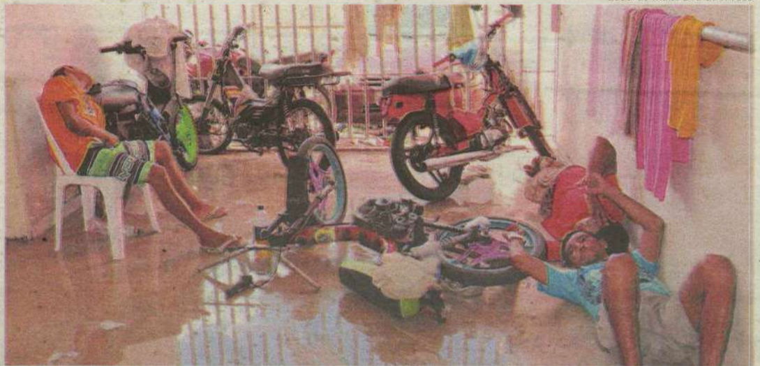
Presos reclamam da falta de higiene e desconforto. Única cela da delegacia, com capacidade para cinco pessoas, abriga 34

A expectativa da Secretaria de Estado da Segurança Pública e da Defesa Social (Sesed) era transferir até o final da tarde de ontem entre 30 e 35 detentos para o presídio de Parnamirim. Contudo, no início da noite somente seis detentos haviam sido transferidos para a unidade prisional. Segundo os agentes não havia possibilidade de outros detentos serem levados durante a noite. A assessoria da Sesed informou ainda que até sexta-feira o órgão es-