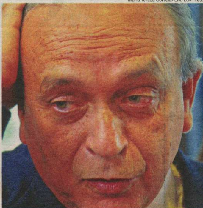
Sérgio Guerra deve ser reconduzido à Presidência da sigla pela terceira vez

Outro agravante da crise ocorre porque os serristas exigem ocupar a Secretaria-Geral - segundo posto hierárquico da legenda - pa-