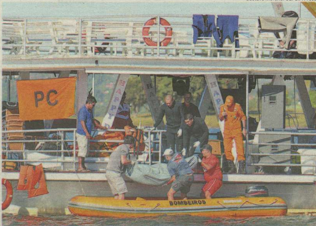
Nomes das vítimas já resgatadas foram divulgados ontem em boletim emitido pela Polícia Civil

Matos ouviu ontem sete depoimentos na busca pela apuração das responsabilidades envolvendo o acidente com o barco, ocor-