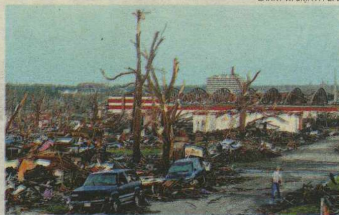
Ventos foram os mais destrutivos desde a década de 50 no país

Trata-se, segundo a imprensa, do tornado mais destrutivo registrado nos Estados Unidos desde a década de 50. Durante o fim