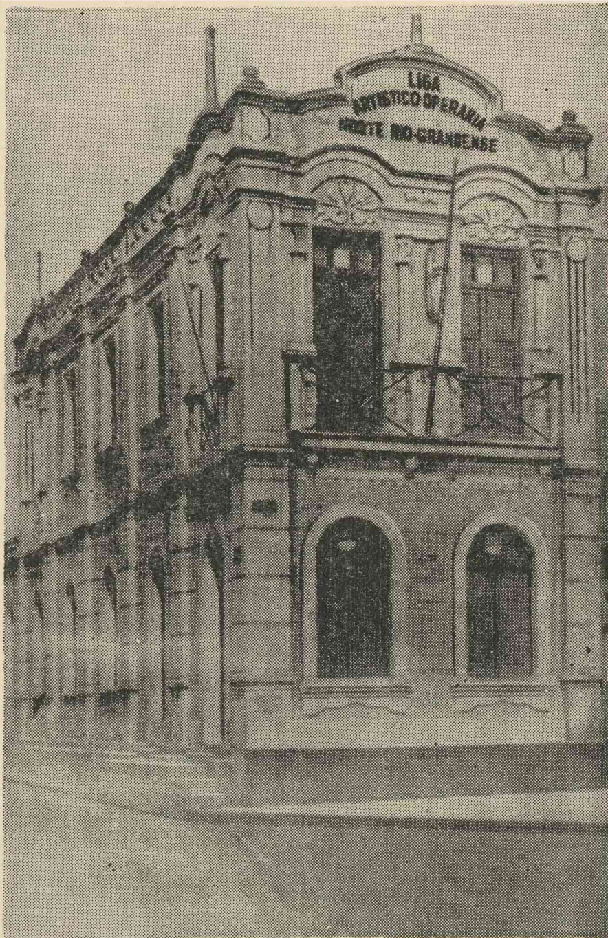
Sede Própria: Av. Rio Branco, 621 - 1º and. - Natal - RN