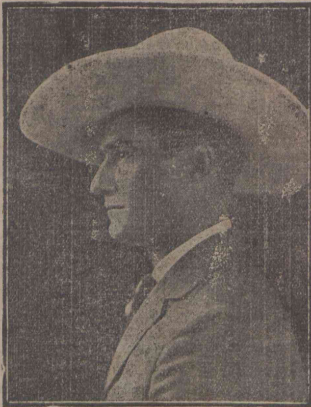
TOM MIX—admirado artista norte-americano, cujas proezas arrebatam os apreciadores de fitas cinematographicas.