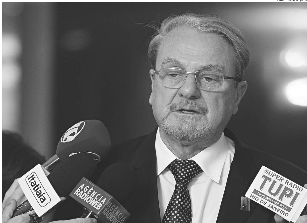
// Marcio Lacerda, presidente da Frente Nacional de Prefeitos: alegações práticas e legais ao ministro do TCU

cio Lacerda afirmou que a Advocacia-Geral da União (AGU) e o Ministério da Fazenda estão preparando um agravo (recurso) à decisão do ministro Carreiro, para que ele volte atrás e permita o repasse nesta sexta-feira, dia 30, conforme previsto originalmente na medida provisória.