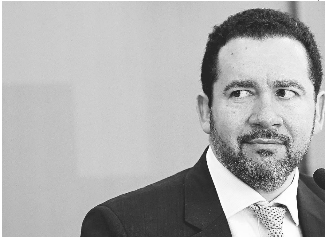
// Dyogo Oliveira, ministro do Planejamento: "Esses reajustes já estavam contratados pelo governo"

O anúncio do aumento de salários foi feito durante a entrevista para apresentar resultados da reforma administrativa que cortará vagas na máquina pública e prevê economizar R$ 240 milhões por