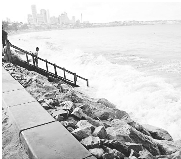
Praia de Ponta Negra, Natal-RN