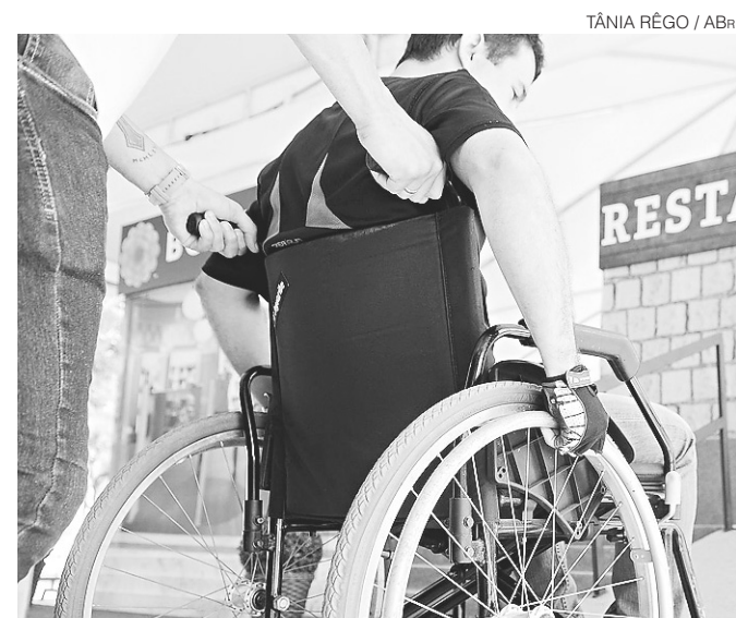
Medida altera Lei 12.711, de 2012, a chamada "Lei de Cotas"

A expectativa do governo federal é que a capacidade de atendimento das atuais 520 UPAs praticamente dobre em todo o país, chegando a 960 unidades em funcionamento.