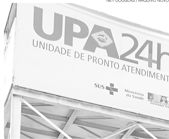
Com a medida, cada UPA terá no mínimo dois médicos

Fechados: dias 30, 31 dezembro e 01 de janeiro.