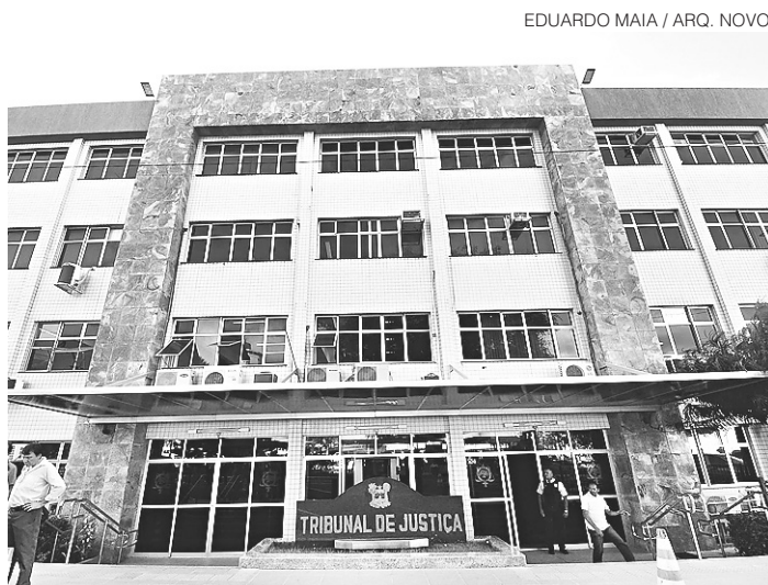
EDUARDO MAIA / ARQ. NOVO

A licitação ocorrerá na modalidade de concorrência, do tipo menor preço, sob