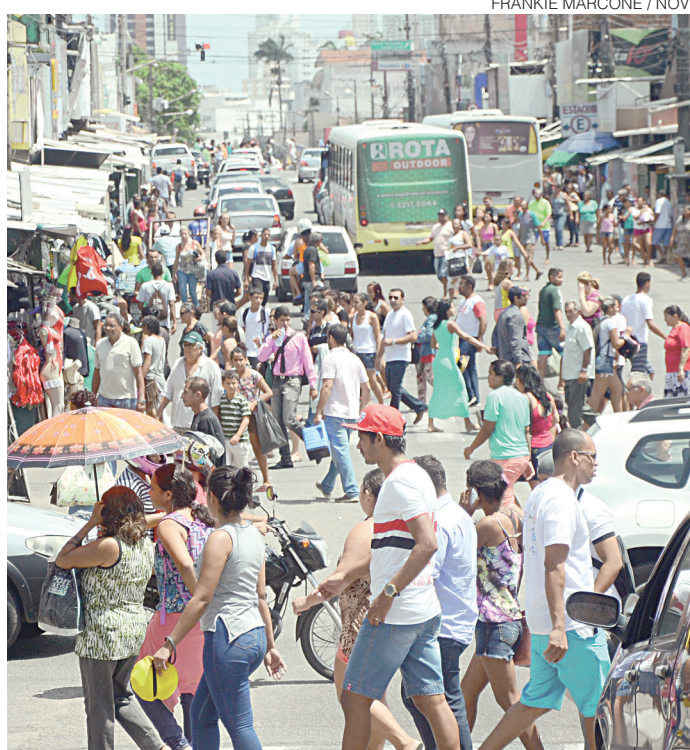
// Taxa de desemprego chega a 11,9% em novembro

Desde janeiro de 2014, o IBGE passou a divulgar a taxa de desocupação em bases trimestrais para todo o território nacional. A pesquisa substituiu a Pesquisa Mensal de Emprego (PME), que abrangia ape-