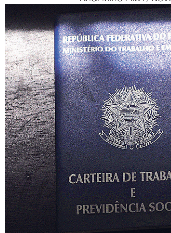
// Controle de gastos terá efeito no emprego a longo prazo