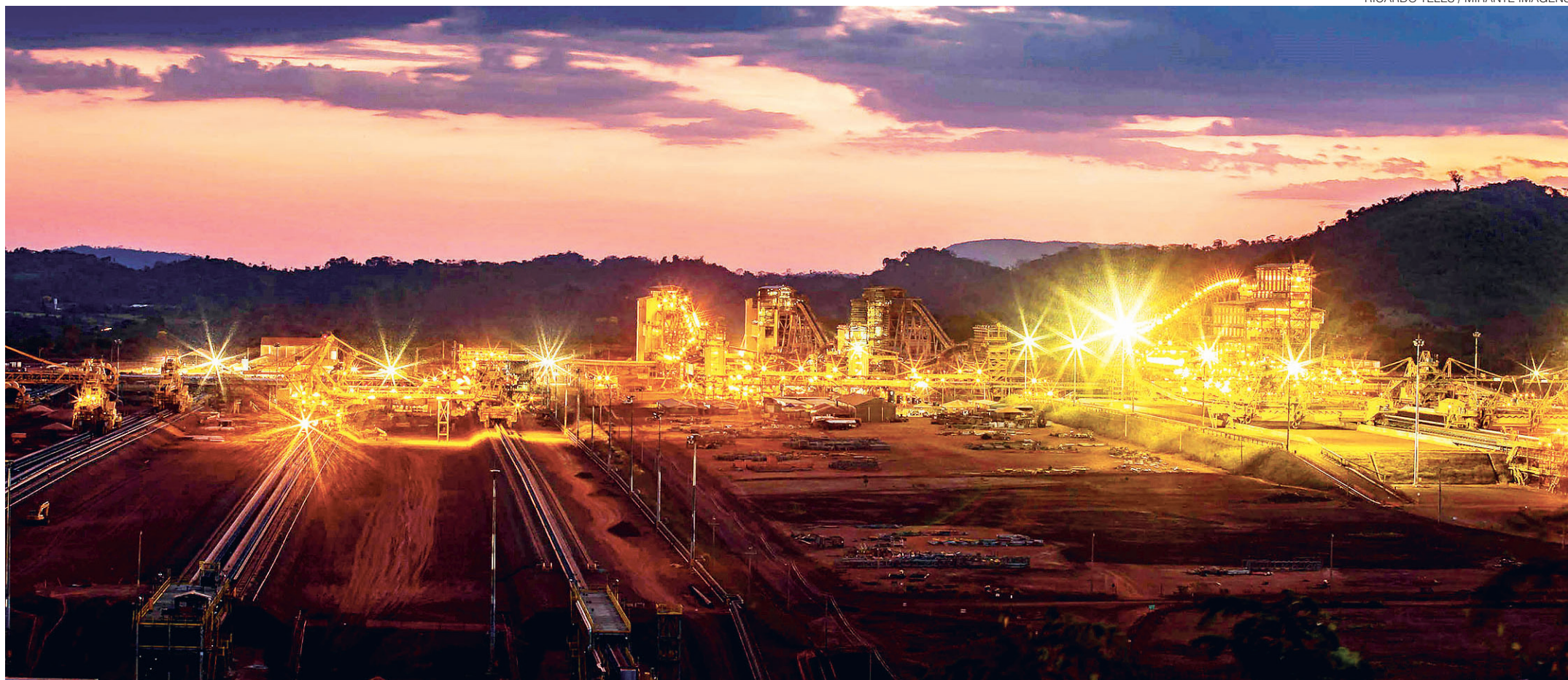
// Nova unidade da Vale, em Canaã do Carajás, no Pará, considerado o maior projeto de mineração do mundo, tem expectativa de gerar 2,7 mil empregos diretos e 10 mil indiretos em 2017