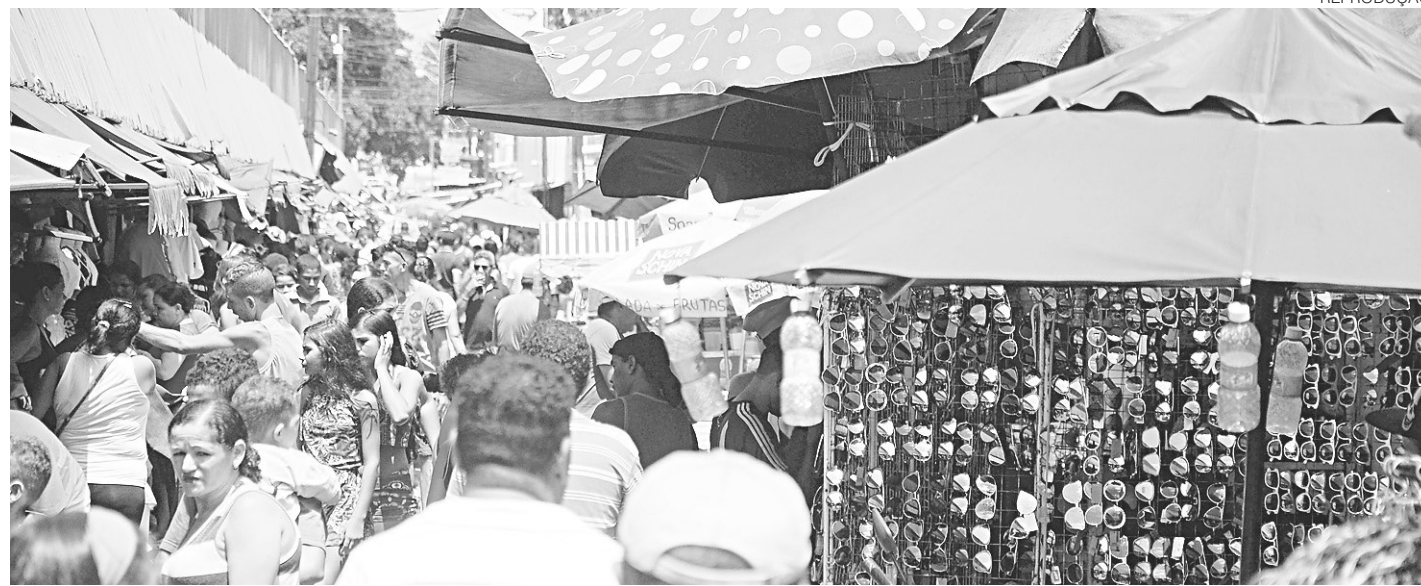
REPRODUÇÃO // De acordo com a Câmara dos Dirigentes Lojistas de Natal, as lojas de rua e shoppings funcionam amanhã, dia 31, com horários reduzidos

Festas de fim de ano alteram horários do comércio e serviços em Natal; agências bancárias só voltam a funcionar dia 2 de janeiro